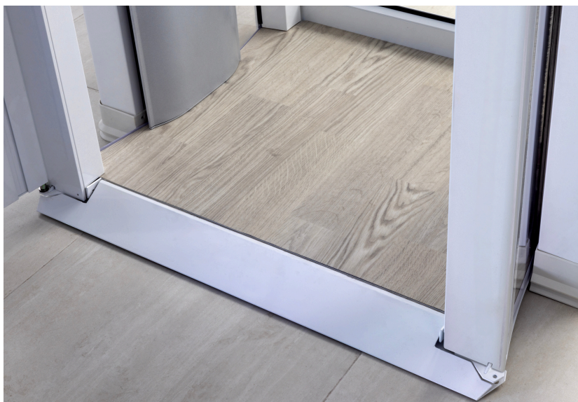
Seuil incliné et revêtement de sol antidérapant