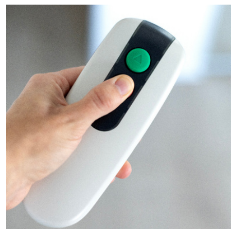
Télécommande pour appeler l'ascenseur